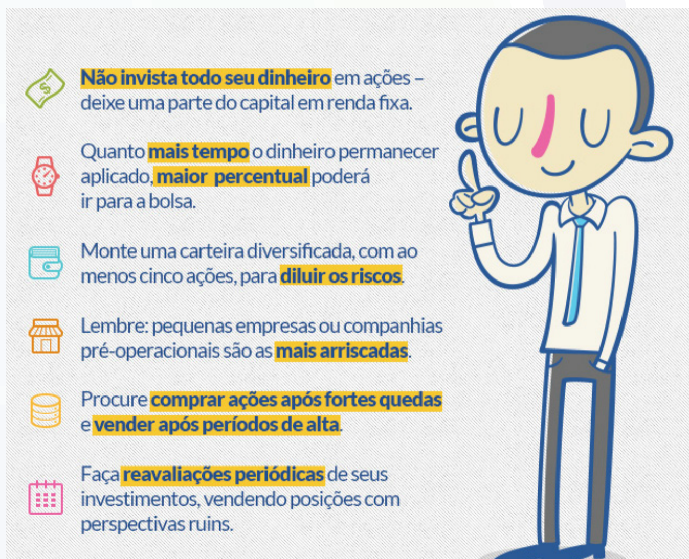
Figura 1 – Dicas para Investir em ações:

Os Investidores podem obter informações e orientações sobre o mercado com profissionais qualificados, os chamados intermediários. Estes recebem as ordens dos investidores e as repassam aos operadores que têm acesso ao sistema de negociação das Bolsas. Os Investidores podem, ainda, enviar sua ordem de compra e de venda via Internet, por meio do site de seu intermediário, utilizando-se de seu Home Broker. O Home Broker possibilita maior facilidade para pequenos investidores, pois o investidor vai enviar sua ordem diretamente ao sistema da Bolsa, podendo operar nele Lotes Fracionários. O Home Broker é o instrumento que permite a negociação de ações via Internet. Ele permite que você envie ordens de compra e venda de ações através do site de sua corretora na internet.