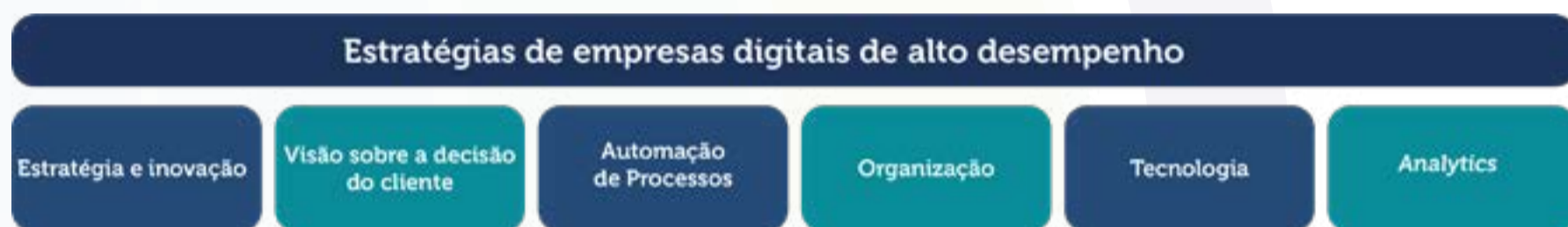
Figura 2 – Estratégias de empresas digitais de alto desempenho